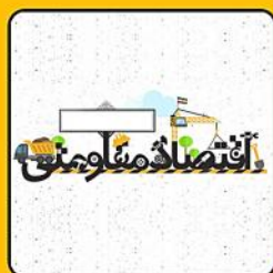
اقتصاد مقاومتی، استوار بر علوم پایه