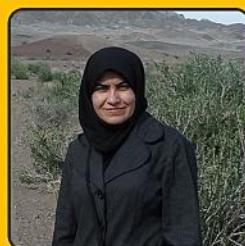
گفت و گو با دکتر قبادی پور