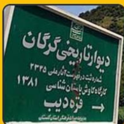
دیوار تاریخی گرگان