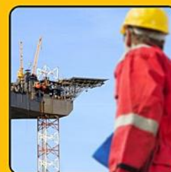
نقش زمین شناسان در دکل های نفتی